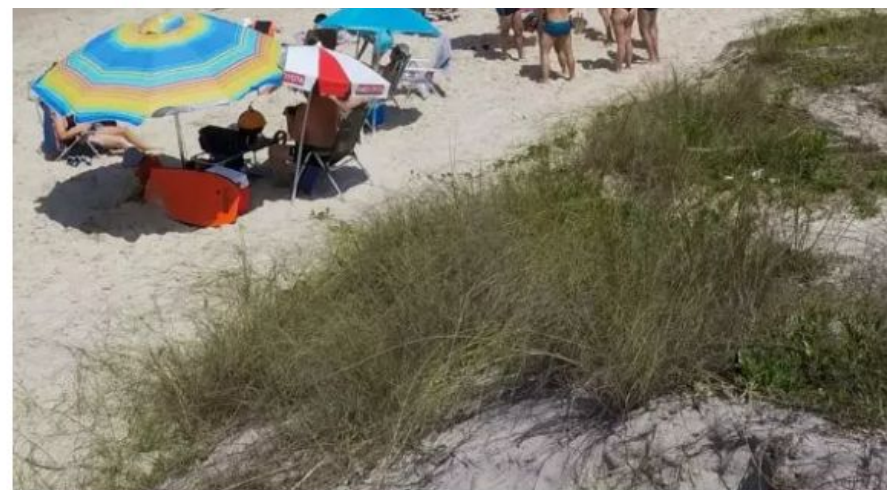
Praia de Ingleses, no Norte da Ilha de SC

Projeto que pretendia proibir os equipamentos na areia, motivo de reclamações e atritos no verão, foi arquivado pela Câmara