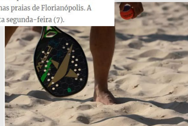
Futebol, altinha e frescobol podem ser proibidas nas praias durante o verão se projeto for aprovado pela Câmara de Florianópolis